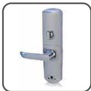
✓ Cerrojo de activación interna