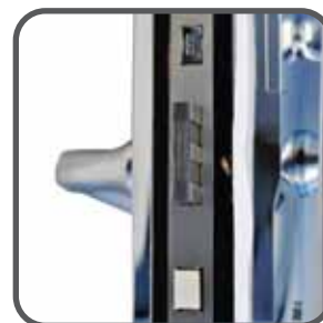
✓ Múltiples cerrojos y pestillos

↘ Tekno Homes S.A. +54 (11) 5031-1964 ☎ +54 (911) 3205-4803 Av. Congreso 2171 Piso 5°A (C1428BVE), C.A.B.A., Argentina info@teknohomes.com