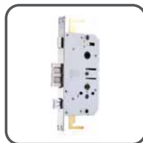
✓ Sistema Múltiple anclaje