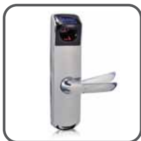
✓ Manija reversible